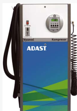
Combi BOY CAB