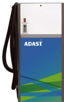
Combi BOY CB